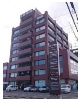
訓練実施施設の外観