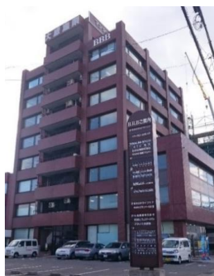
訓練実施施設の外観